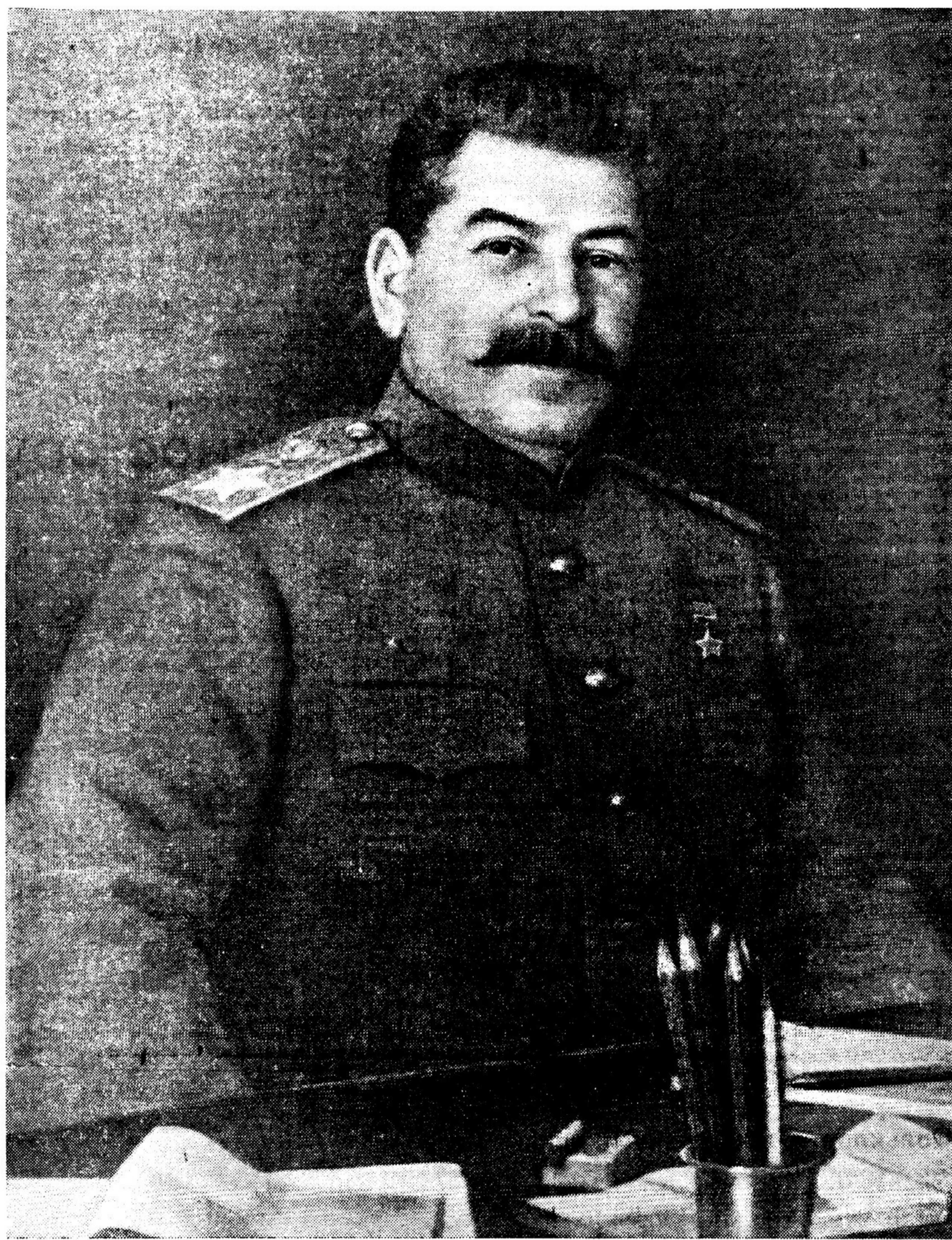
Председатель Государственного Комитета Обороны, Верховный Главнокомандующий Маршал Советского Союза товарищ И. В. СТАЛИН.