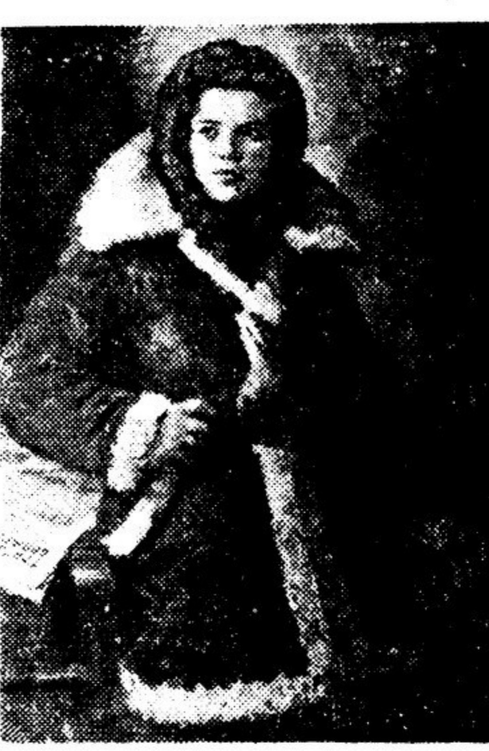
Портрет белорусской партизанки. Художник Ф. МОЛОГОВ.